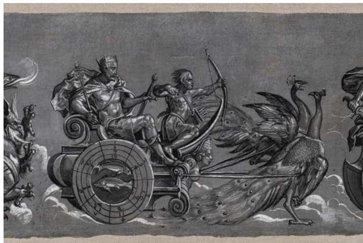
Tobias Stimmer, Chariots of the Seven Days : detail with Jupiter (Thursday), preparatory design for the Clock sculptures, tempera on canvas, c. 1571. Museums of the City of Strasbourg.

Exhibition Curator: Cécile Dupeux , Chief Curator of the Musée de l'Œuvre Notre-Dame