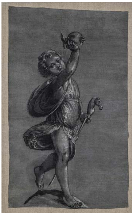
Tobias Stimmer, The Four Ages of Life: Childhood , preparatory design for the Clock sculptures, tempera on canvas, c. 1571, 72 x 42 cm.

Museums of the City of Strasbourg.