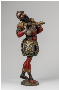
3. Tobias Stimmer, Les Chars des sept jours : détail avec Jupiter (jeudi) projet pour les sculptures de l'horloge, détrempe sur toile, vers 1571. Musées de la Ville de Strasbourg.