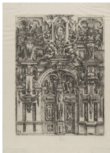
5. Wendel Dietterlin, Portail corinthien d'un jardin , planche gravée extraite de l' Architectura [...], 3 e version, Nuremberg, Hubrecht et Balthasar Caymox, 1598, planche 152, eau-forte et burin sur papier, 25 x 18 cm. Strasbourg, Cabinet des Estampes et des Dessins.