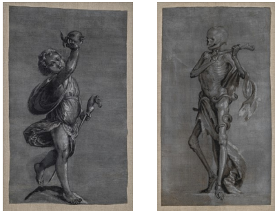
1. Tobias Stimmer, Les quatre Âges de la vie : l'Enfance , projet pour les sculptures de l'horloge, détrempe sur toile, vers 1571, 72 x 42 cm. Musées de la Ville de Strasbourg.

Demande à adresser : Service communication Musées de la Ville de Strasbourg Julie Barth 2 place du Château, Strasbourg julie.barth@strasbourg.eu Tél. + 33 (0)3 68 98 74 78